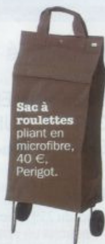
Sac à roulettes pliant en microfibre, 40 €, Perigot.