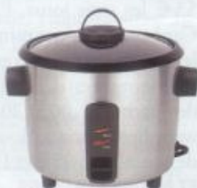
Ricecooker tout inox. Kenwood, 46 €, Darty.