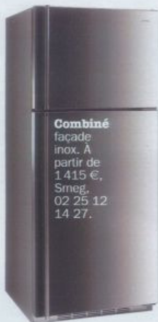
Combiné façade inox. À partir de 1 415 €, Smeg, 02 25 12 14 27.

DES OBJETS ET DES MEUBLES ACTUELS QUI ONT TOUT POUR EUX ET QUI VONT PARTOUT.