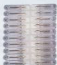
Pinces à linge transparentes, 3€ le set de vingt, Perigot.