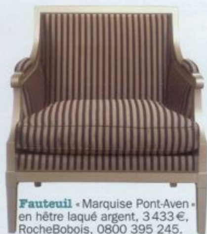
Fauteuil « Marquise Pont-Aven » en hêtre laqué argent, 3 433 €, RocheBobois, 0800 395 245.