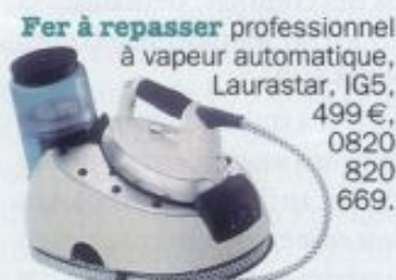
Fer à repasser professionnel à vapeur automatique, Laurastar, IG5, 499 €, 0820 820 669.