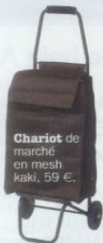
Chariot de marché en mesh kaki, 59 €.