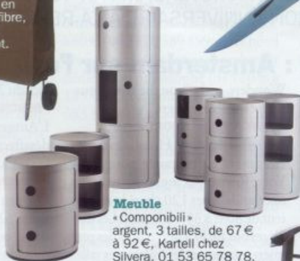
Meuble « Componibili » argent, 3 tailles, de 67 € à 92 €, Kartell chez Silvera, 01 53 65 78 78.