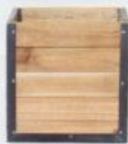
Jardinière en planches, 3 tailles, de 20 € à 25 €, Habitat.