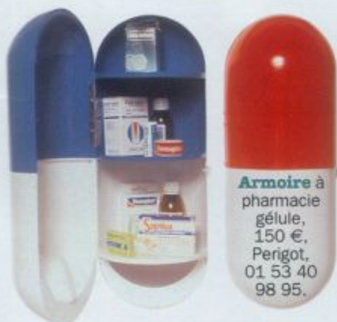
Armoire à pharmacie gélule, 150 €, Perigot, 01 53 40 98 95.