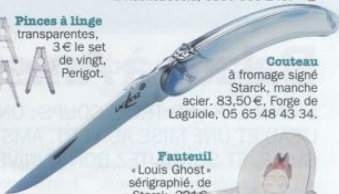
Couteau à fromage signé Starck, manche acier. 83,50 €, Forge de Laguiole, 05 65 48 43 34.