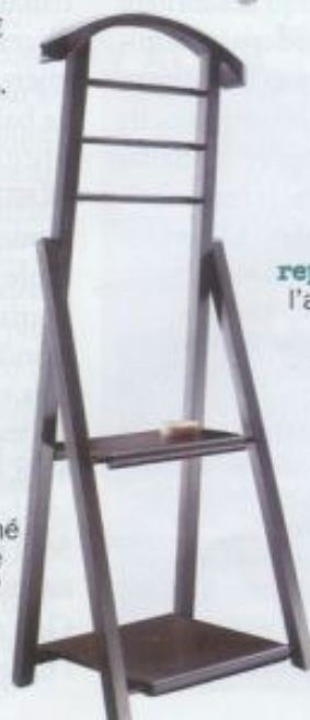
Valet en bois dessiné par Terence Conran, VIP Products, 140 € Habitat.