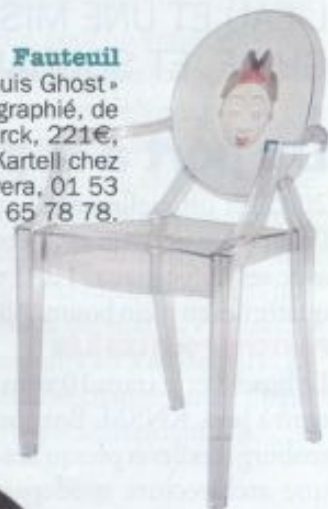
Fauteuil « Louis Ghost » sérigraphié, de Starck, 221€, Kartell chez Silvera, 01 53 65 78 78.